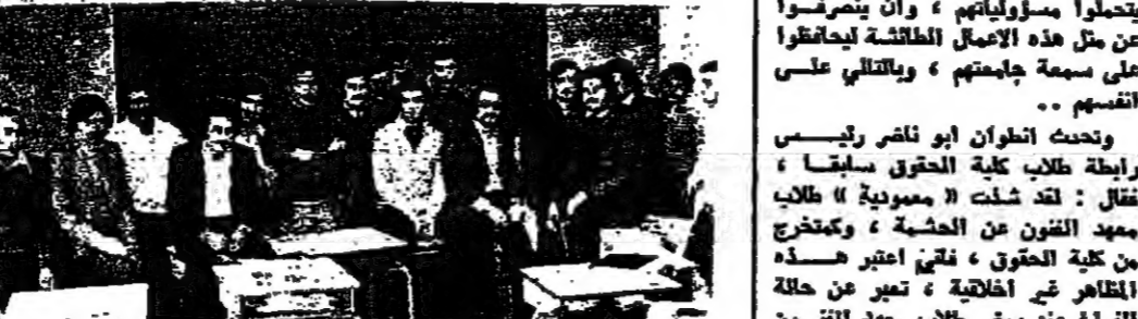
طلاب المعهد الفني السياسي الدكوانة اثناء اعتصامهم امس

نفاذ امس وطلاب المهنيين الفنيين الصناعيين العمالي والسياسيين في الدكوانة والاضراب والاحتقاص في صفوف طلابهم بمتصرف شهادة التميز الفني التي يمنحها خريجو المهنيين بالفترة الثالثة الربيعية، كما اعلن طلاب «المدرسة الوطنية للاعدادات الفنيين التجاريين والسياسية» والاضراب والفروع من أجل «عدة مطالب اسمية وداخلية».